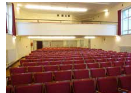
Studio - Logis : la grande salle.