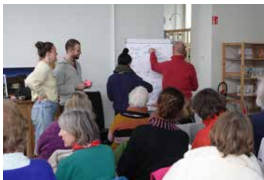
Première réunion de création de l'asbl 18 mars 2024

Une première réunion a eu lieu en mars pour présenter les statuts, trouver un nom et désigner des membres fondateurs. En tant qu'habitant, il est toujours possible de rejoindre le projet et devenir membre de l'asbl. Beaucoup de choses sont encore à construire.