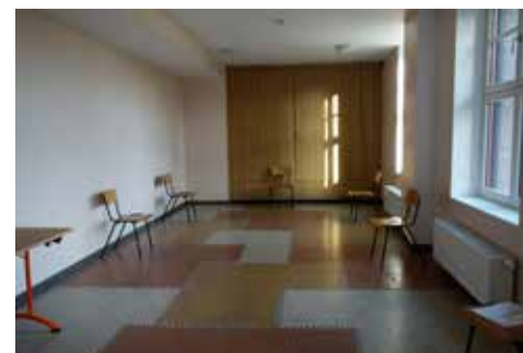
La Maison de tous