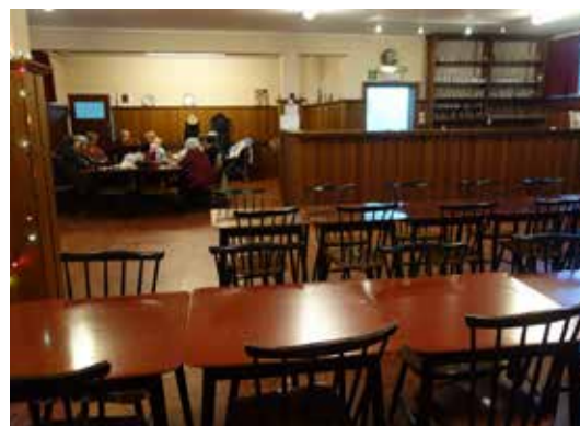
Studio - Logis : le bar

A l'origine, la construction des cités-jardins du Logis et de Floréal incluait la mise en place d'espaces pouvant accueillir la vie coopérative (commerces, salles de fêtes, salles de spectacles, etc.). A l'occasion des 100 ans de la coopérative, nous nous sommes demandé comment « cet esprit coopératif » résonnait encore aujourd'hui aux oreilles des locataires et des habitants et comment le (re)dynamiser. L'idée de créer une asbl a alors germé. C'est aujourd'hui chose faite : le Conseil d'administration du Logis - Floréal a décidé de co-crée une asbl avec les habitants intéressés pour faire vivre ses différents espaces.