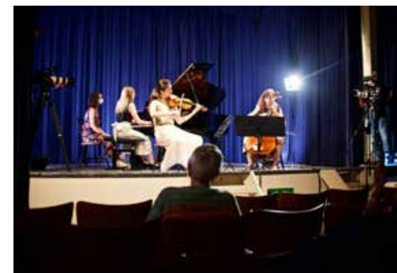
Studio - Logis : la scène

Rejoignez-nous pour construire cette nouvelle asbl qui permettra de soutenir les projets d'habitants du quartier !