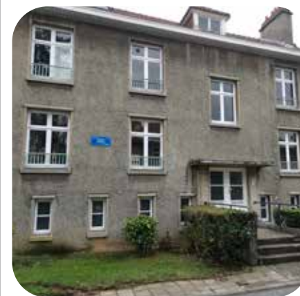
« Bloc gris »