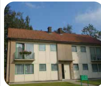
« Béguinage »

🌡️ Le chauffage a déjà été rénové dans 74 logements. 18 bâtiments sont passés au chauffage collectif.