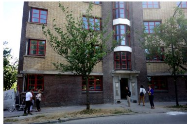
Square des Archiducs, avant/après