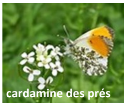
cardamine des prés

Elle est aussi appelée « cresson des prés » pour le goût piquant de sa fleur. Ses rosettes de feuilles font un excellent condiment qui peut apporter une touche piquante aux salades.